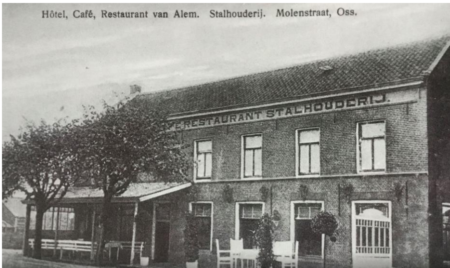
Herberg Van Alem aan de Molenstraat in Oss

Toegangsnummer: 24 Inventarisnummer: 188 Rolnummer: 60