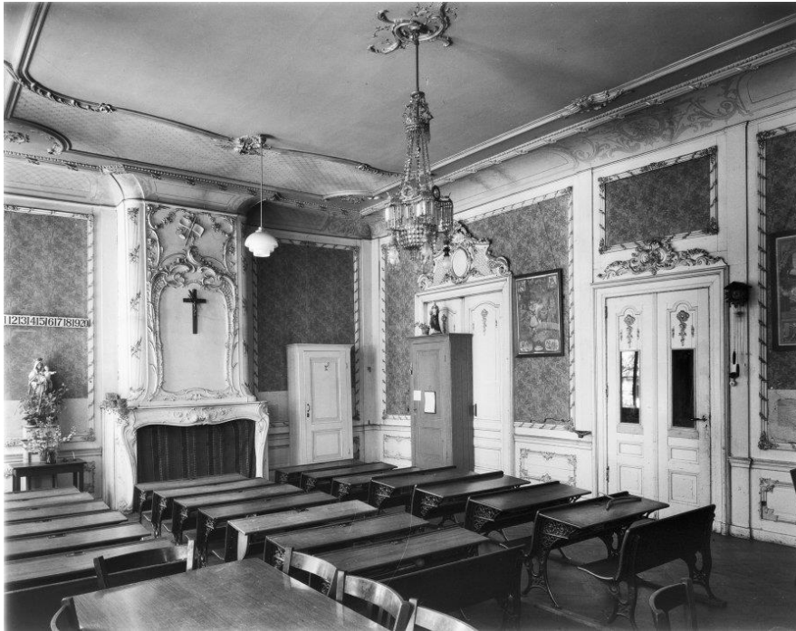
Foto: Eerste etage klaslokaal, Rijksdienst voor het Cultureel Erfgoed (vóór de verbouwing in 1952): het interieur van de grote zaal op de eerste etage

Tussen 1909 en 1922 wordt het smalle pakhuis aan de linker zijde op Keizersgracht 85 gekocht en gesloopt. Op de vrijgekomen grond verrijst de uitbreiding van nummer 87, één raam breed. Vandaar dat de ingang niet meer in het midden zit, zoals gebruikelijk langs de gracht.