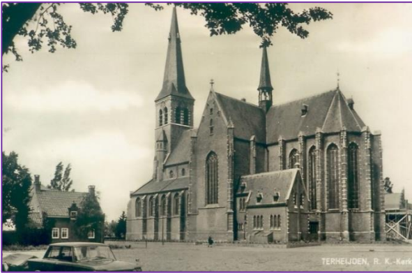
Boven: De Antonius Abtkerk in 1963 met links de kosterwoning. Deze werd later gesloopt om plaats te maken voor nieuwbouw van de Rabobank, nu restaurant de Buren.