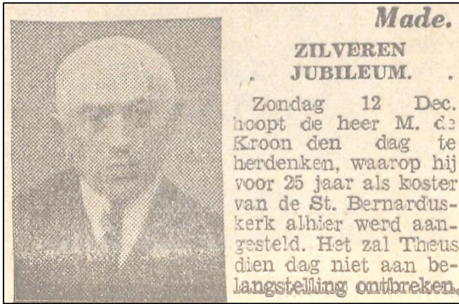
"Dagblad van Noord-Brabant". Breda, 11-12-1937.