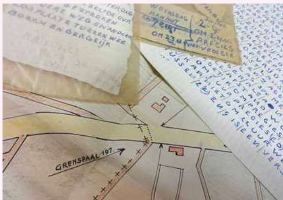
Kaart en briefjes gebruikt bij de smokkel van boter en vee, samen met een verklaring van de verdachte opgenomen in het archief van de arrondissementsrechtbank in 's-Hertogenbosch.

vinden in archieven van andere gemeentebesturen, maar ze zijn doorgaans niet digitaal op naam ontsloten. Geen grote series dus, maar losse dossiers als krenten in andere pap.