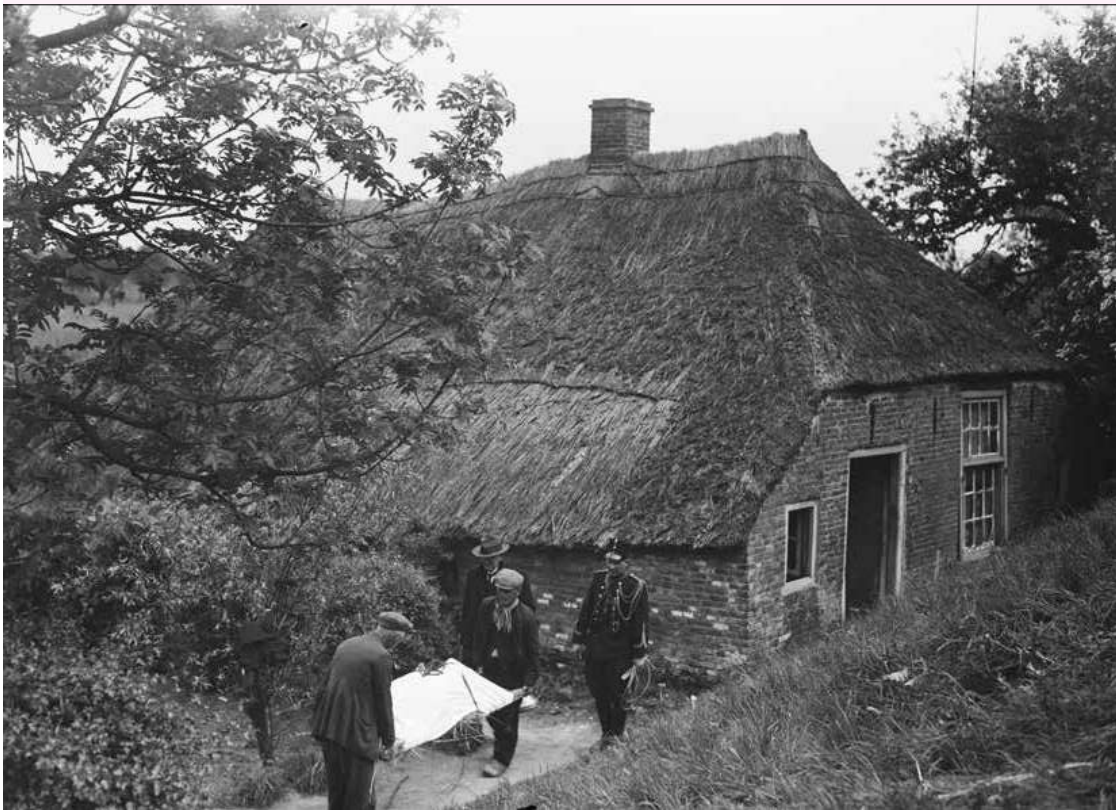
Een slachtoffer van de roofmoord op de gebroeders Verhoeven, in de nacht van 15 op 16 mei 1934, wordt weggedragen van de boerderij. De daders behoorden tot de 'Bende van Oss'.