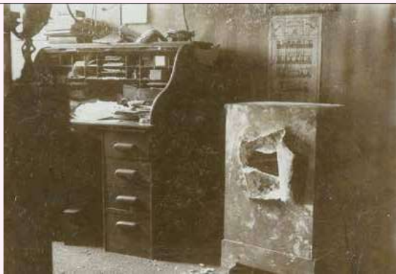
Foto van een gekraakte brandkast, gevoegd bij een dossier in het archief van het Gerechtshof in 's-Hertogenbosch.