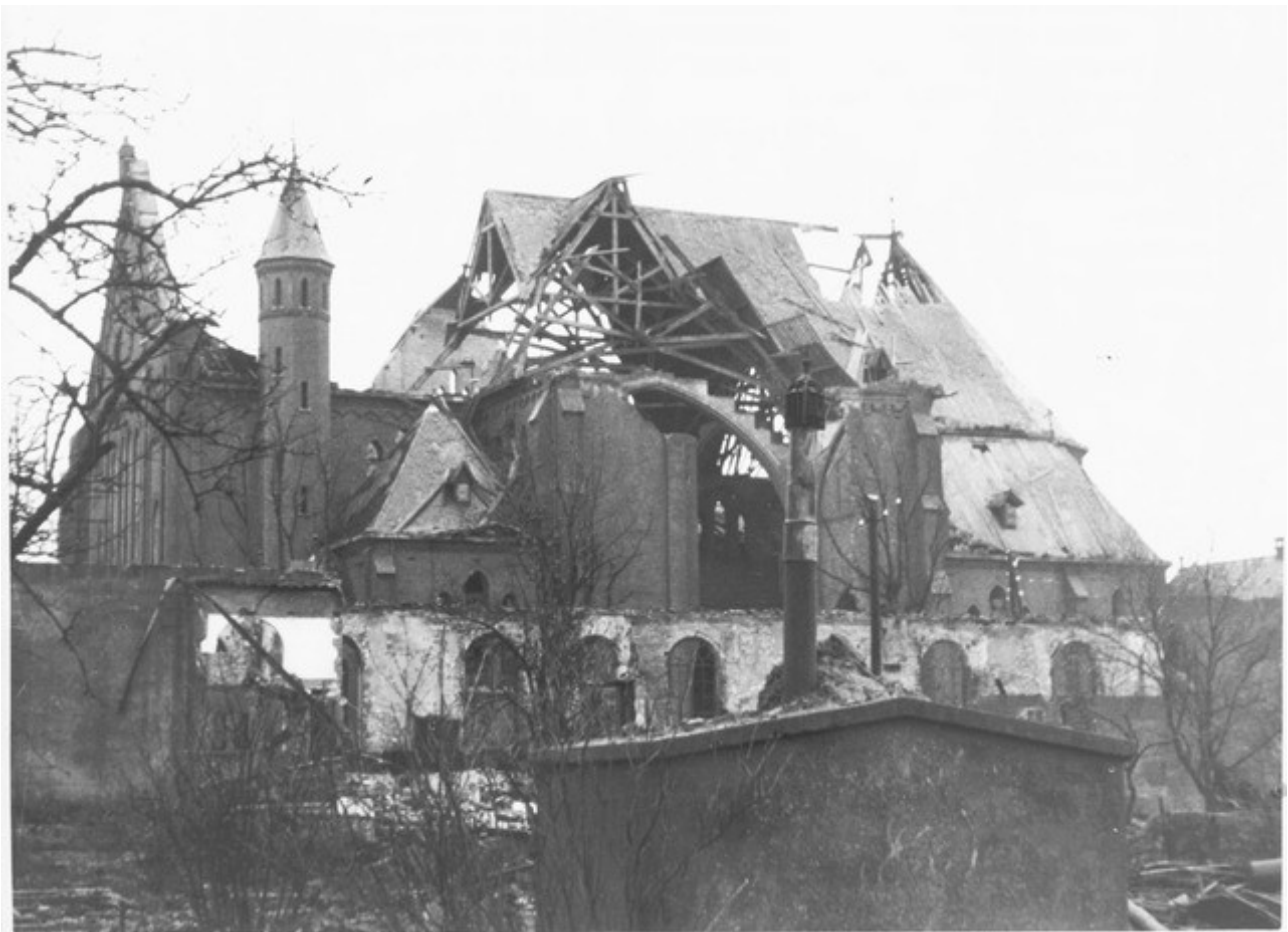
Afbeelding 6: De ruïnes van de Rooms Katholieke Kerk, voor de kerk de restanten van de Openbare School

Tussen 8.30 uur en 10.45 uur komt het No.302 Squadron in actie boven Dinteloord. Ze droppen twaalf 500-ponders en vierentwintig 250-ponders. Die volgens de piloten allen doel treffen. De 6 toestellen van het No.317 Squadron komen wat later tussen 11.40 uur en 13.15 uur. Die gooien vier 500-ponders en drie 250-ponders. Al die bommen vallen in het dorp.