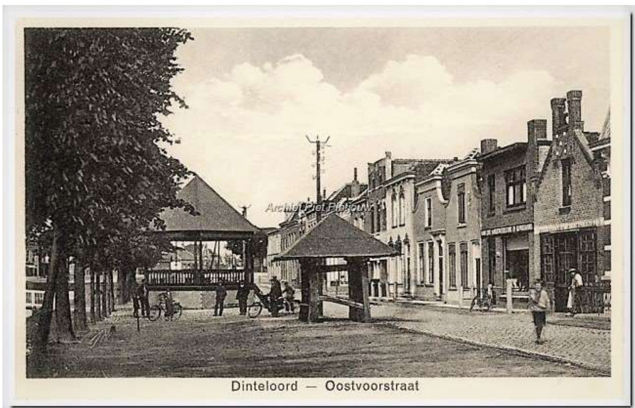
Afbeelding 13: Noordelijk gedeelte van de Oostvoorstraat in de jaren 30

Af en toe gaat er iemand naar buiten om eten te halen, meestal komt die persoon terug met berichten over het feit dat hele delen van Dinteloord gebombardeerd zijn. De mensen brengen de nacht in de schuilkelder door. Het is er klam en vochtig. De andere morgen komen de mensen uit de schuilkelder en gaan op zoek naar andere schuiladressen, vaak buiten het dorp.