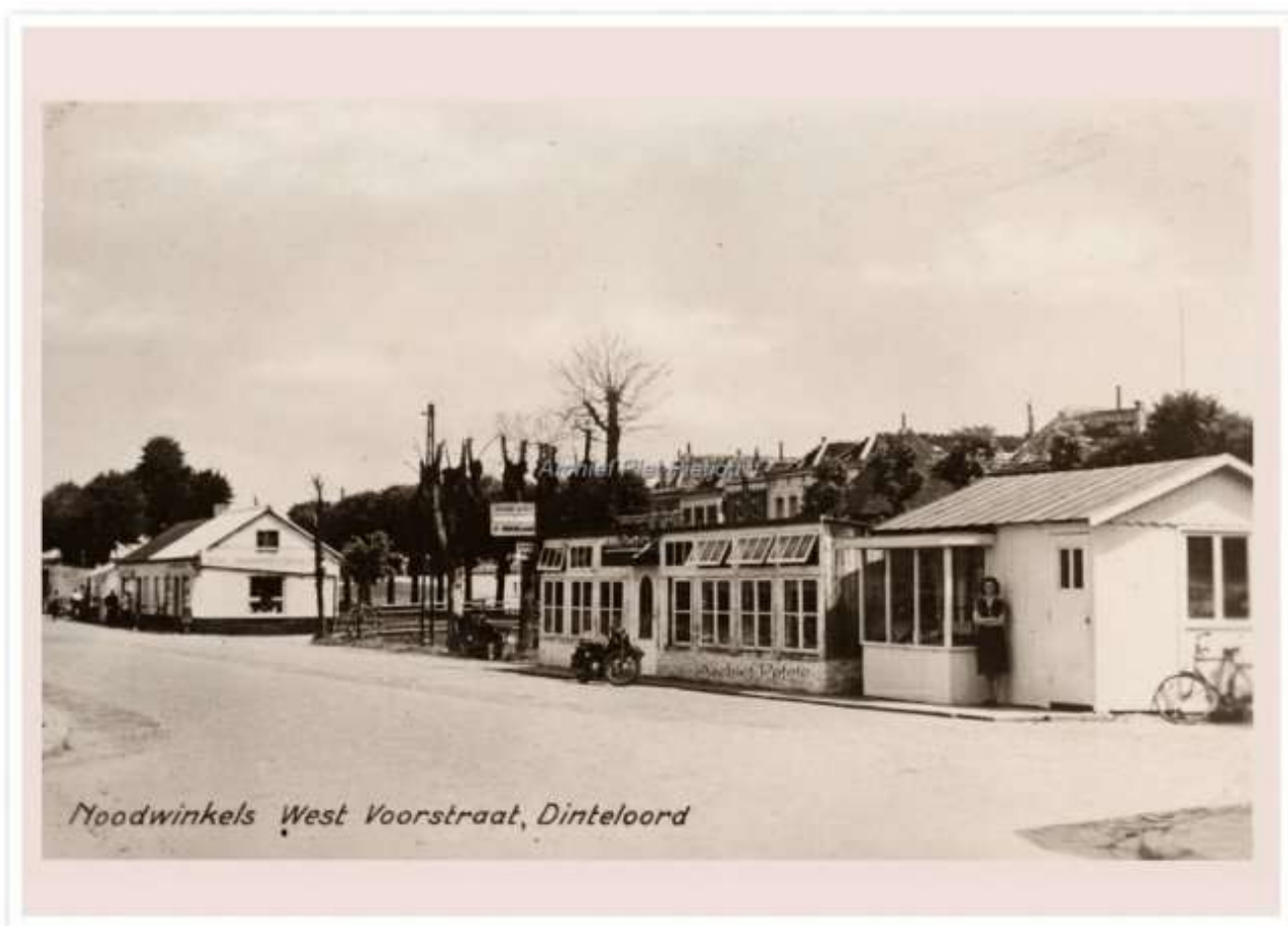
Afbeelding 17