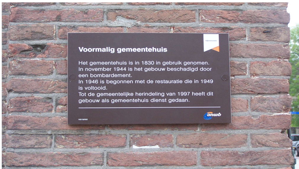
Afbeelding 3: Plaquette op oude Gemeentehuis

Als je nu door Dinteloord loopt kom je een enkele aanwijzing tegen die spreekt over de geallieerde bombardementen. Op het oude raadhuis en de Nederlands Hervormde Kerk zijn kleine teksten geschroefd met een tekst over de stichtingsdatum, het bombardement van 1944 en de hersteldatum van die gebouwen.