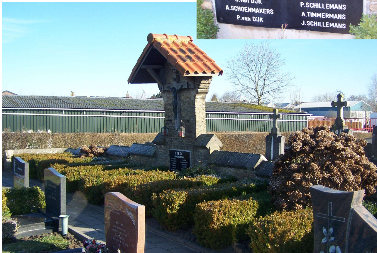
Afbeelding 2: Herdenkingsmonument op de R.K. begraafplaats in Dinteloord

Het is opvallende hoe weinig er gepubliceerd is in de kranten over deze bombardementen. In de jaren kort na de oorlog kom je artikelen tegen over het herstel van de schade en dan nog in het bijzondere die van de openbare gebouwen, zoals het Raadhuis, de Nederlands Hervormde Kerk en de Rooms Katholieke Kerk. Soms wordt er in een enkele bijzin iets gezegd over het aantal doden. Er is heel weinig gemeld over de oorzaak en de veroorzakers van alle materieel en menselijk leed in de media.