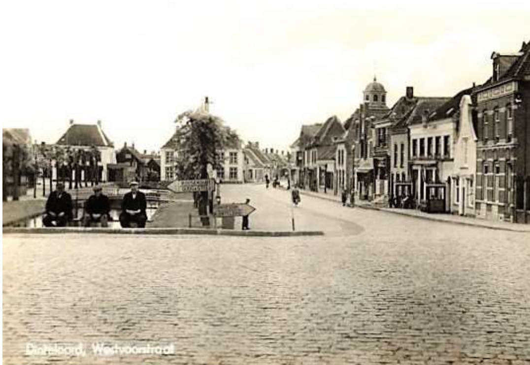
Afbeelding 4: Oostvoorstraat - Kreek - Westvoorstraat

Op de kop van de Oostvoorstraat rechts de Molendijk richting Stampersgat. Helemaal doordraaiend naar zuid begint aan het einde van de Westvoorstraat de Steenbergseweg richting Steenberg. Dit was in 1944 en ook nu nog het hart van het dorp. Vele van de hier genoemde straatnamen kom je verder in mijn onderzoek tegen als getroffen plaatsen door de bombardementen.