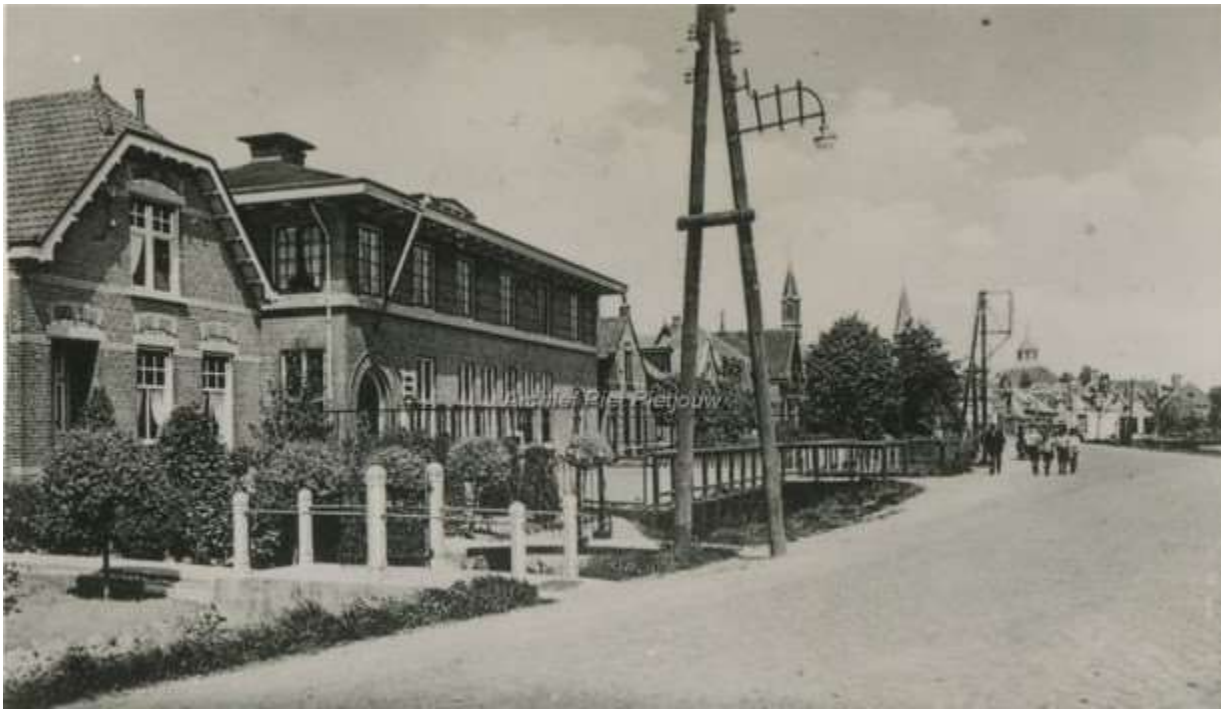
Afbeelding 9: P.T.T. Gebouw Steenbergsche Weg

Het huis van de Familie Korst aan de Steenbergsche Weg B17 is op 4 november, volgens een getuige, letterlijk in zijn geheel de lucht ingevlogen en uit elkaar gespat. Dat huis ligt op zeker 250 meter ten zuiden van de Gereformeerde Kerk. Dichter bij die kerk worden het gebouw van de P.T.T. en 2 daarnaast gelegen woningen volledig verwoest.