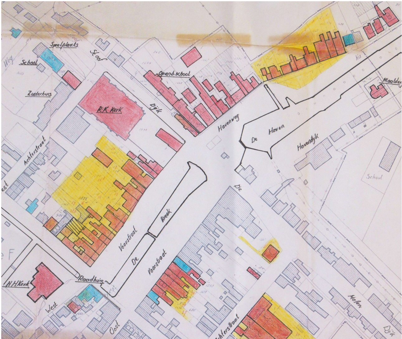
Afbeelding 8: Ingekleurd detail van het Plan tot Wederopbouw Gemeente Dinteloord 1946