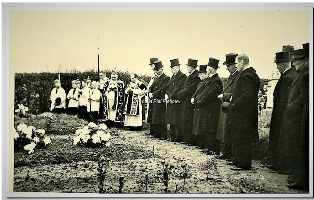
Afbeelding 16: Begrafenis slachtoffers op de R.K. Begraafplaats 1944