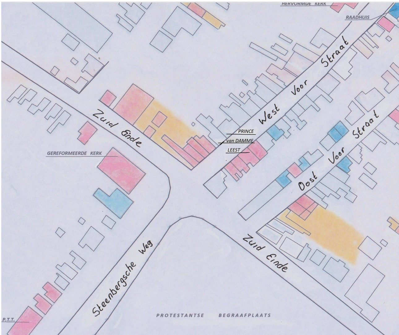
Afbeelding 10: Ingekleurd detail van het Plan tot Wederopbouw Gemeente Dinteloord 1946 Gedeelte rond de Gereformeerde Kerk

Voor de beide vaders wordt op 30 december 1944 de overlijdensakte opgesteld. Voor de 6 overige slachtoffers lukt dat dan niet. Kennelijk zijn zij niet identificeerbaar en worden zij dus als vermist aangemerkt. In mei 1951 maakt de gemeente Dinteloord op aanwijzing van Justitie hun overlijdensakte op met als datum van overlijden 4 november 1944.