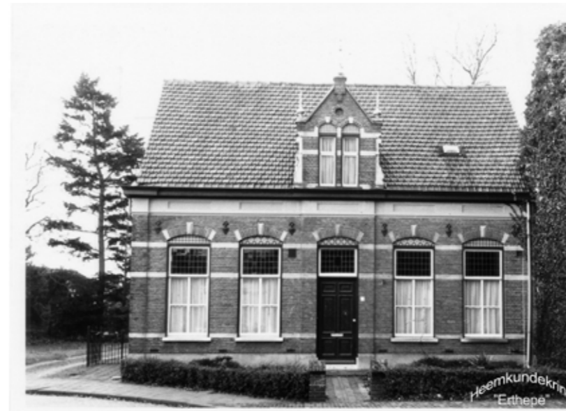
PYJAMA-HOUSE, WONING FAMILIE OTTEN, KERKSTRAAT 6 ERP