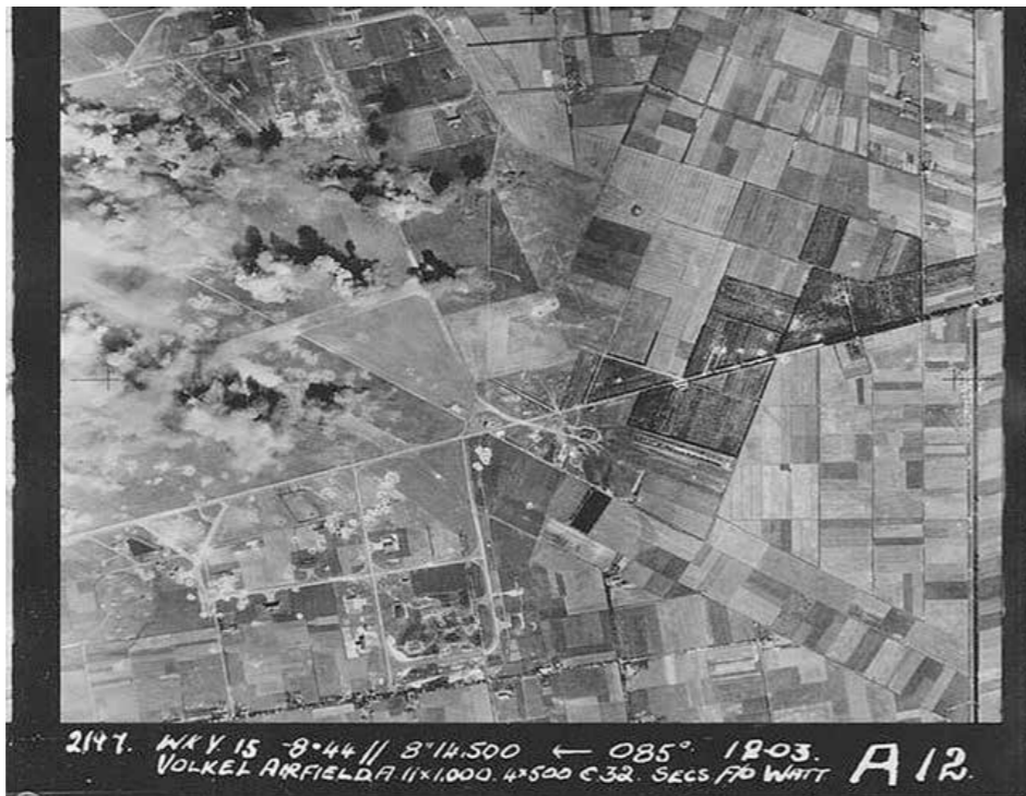
FLIEGERHORST VOLKEL NA RAF-BOMBARDEMENT, 15 AUGUSTUS 1944