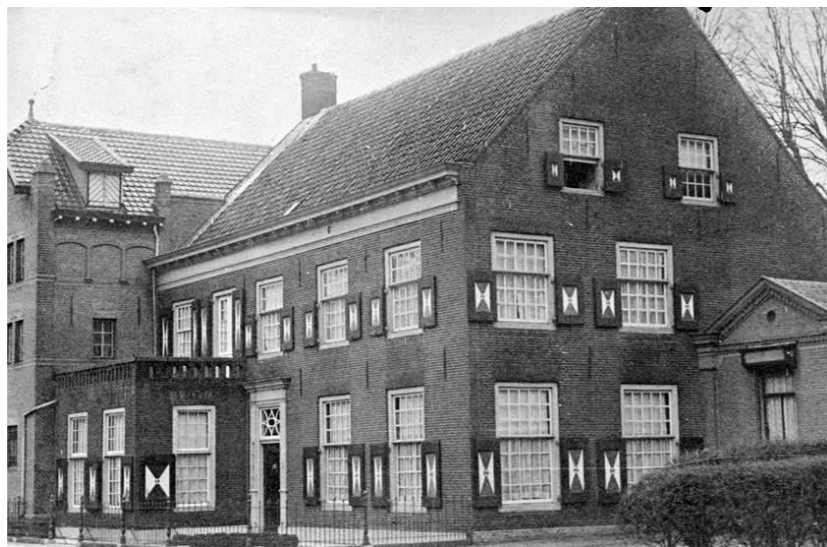
VILLA VERHEIJEN BIJ LEERLOOIERIJ BRESSERS, 1907-1932