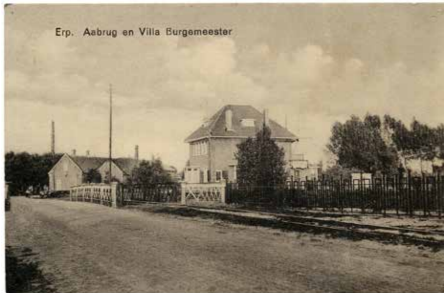
AMBTSWONING BRUGSTRAAT 71, ERP, CA. 1935

Erp telde in de oorlog zo'n 3385 inwoners, waarvan het merendeel in de dorpskern woonde en de rest in de gehuchten Keldonk en Boerdonk 13 . De feestelijke installatie volgde op 4 augustus. Zwaaiende vaandels, praalwagens, muziekgezelschappen, sportverenigingen: alles en iedereen liep uit om de nieuwe burgervader een hartelijk wel-