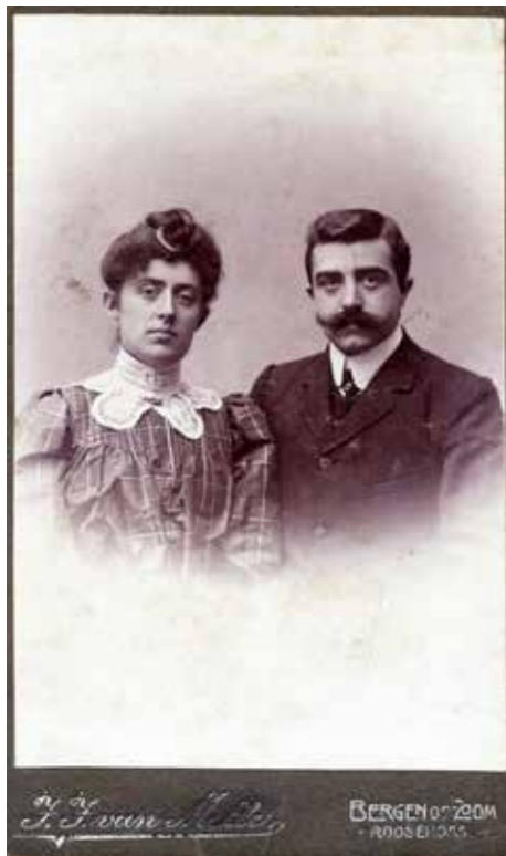
OPA EN OMA VERHEIJEN-BRESSERS SAMEN JONG

In Dongen zelf was hij betrokken bij diverse sociale en maatschappelijke verenigingen. Vijftientig jaar lang lid van de Sint Vincentiusvereniging, medeoprichter en voorzitter van de R.K. Woningbouwvereniging 'De Gode Woning'. Meer dan 17 jaar lang was hij president van de Koninklijke Harmonie Musis Sacrum. Voorts oprichter en secretaris van de Vereniging tot Bevordering van het R.K. Onderwijs. Het typeert hem als een mensen-mens, een gemeenschaps-mens.