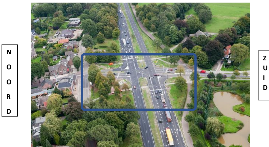
Foto: Kruispunt in Helvoirt met de N65, de Oude Rijksweg, de Torenstraat en de Molenstraat

Een beschrijving van het gesloopte begin van de Molenstraat, de laatste bewoners en de eigenaren