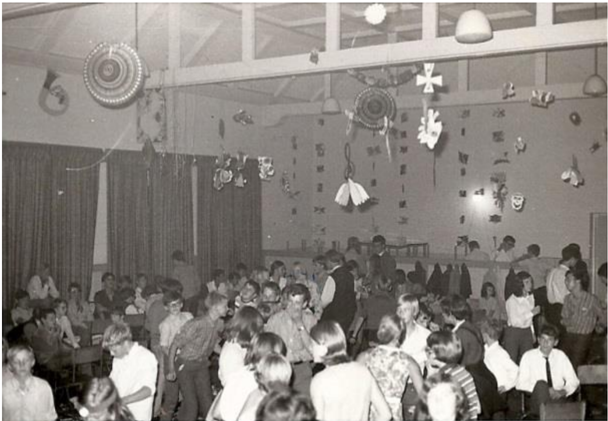
Foto: ook hier weer een jaarlijks feest, maar met de meisjes van de klas erbij. Ik sta in het midden met mijn hand voor mijn mond.