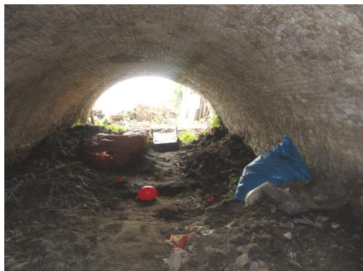
Een interieurfoto zoals de schuilkelder er thans bij ligt