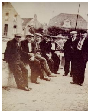
“Hangplek” nabij de sluis