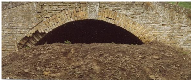
Een voorbeeld van een heul (dit is de heul onder de Zeedijk bij Bax te Hooge Zwaluwe)

aan de weg, stond een grote hoge ligusterhaag. Om reden dat het tuintje beneden aan de dijk was gelegen moest hij eerst het talud afdalen. Terugkijkend naar de straat zag hij aan de voet van de heg, in de hoek nabij de manufacturenzaak van Arjan Weeland, op een hoogte van circa een halve meter onder het wegniveau, iets steenachtigs uit de grond steken. Na enig graafwerk met zijn handen kwam er een begin van een gemetseld gewelf (boog) tevoorschijn.