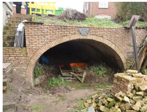
Een foto van de voorzijde van de schuilkelder na de restauratie