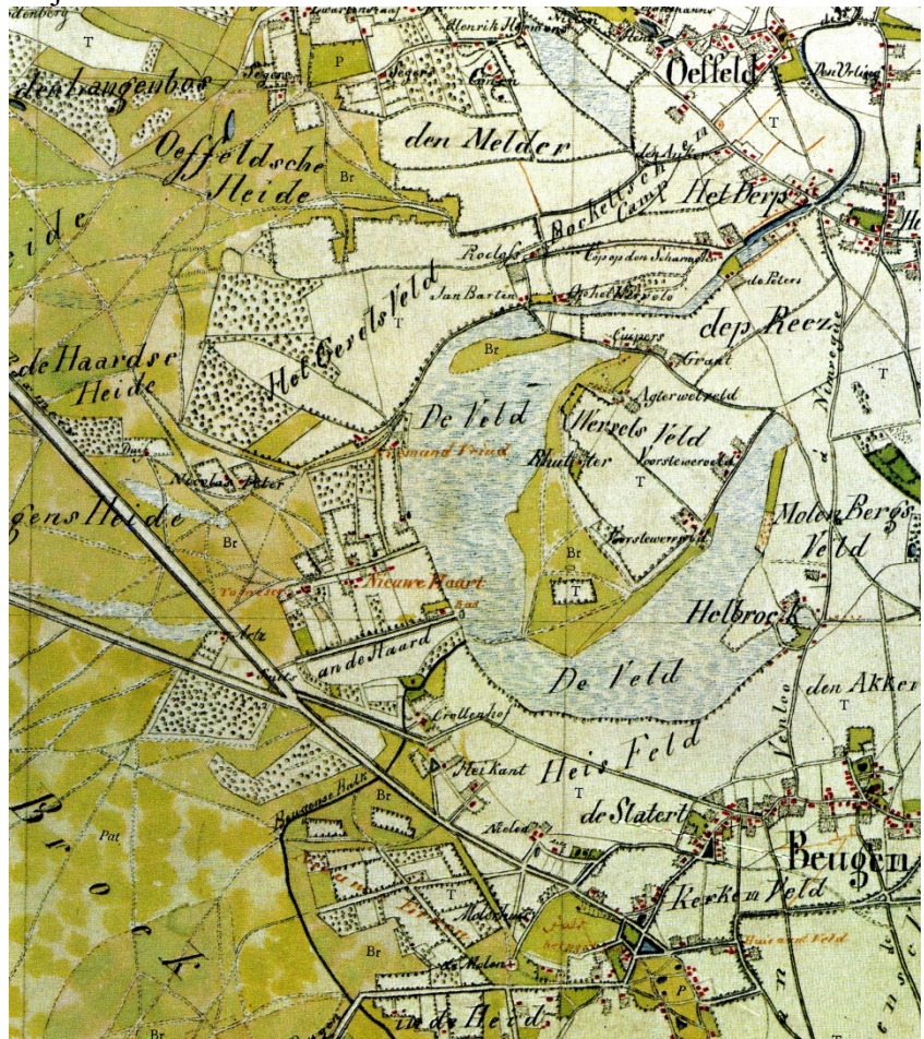
De Nieuwe Haart, aangegeven op de Tranchotkaart van circa 1810.