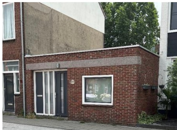
op woensdag 13 juli 2022