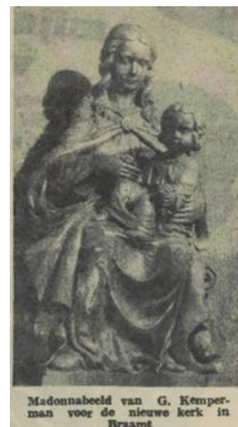
Madonna-beeld van G. Kemperman voor de nieuwe kerk in Braamt

G. KEMPERMAN, een jong beeldhouwer te Bergen op Zoom „Ik werk, zoals ik denk dat het 't beste is” AAN de Parallelweg te Bergen op Zoom woont een beeldhouwer. Hij is jong en zeer bescheiden. Hij heeft moed en hij bezit de heilige overtuiging, dat hij zijn medemens iets te zeggen heeft door middel van zijn artistieke talenten.