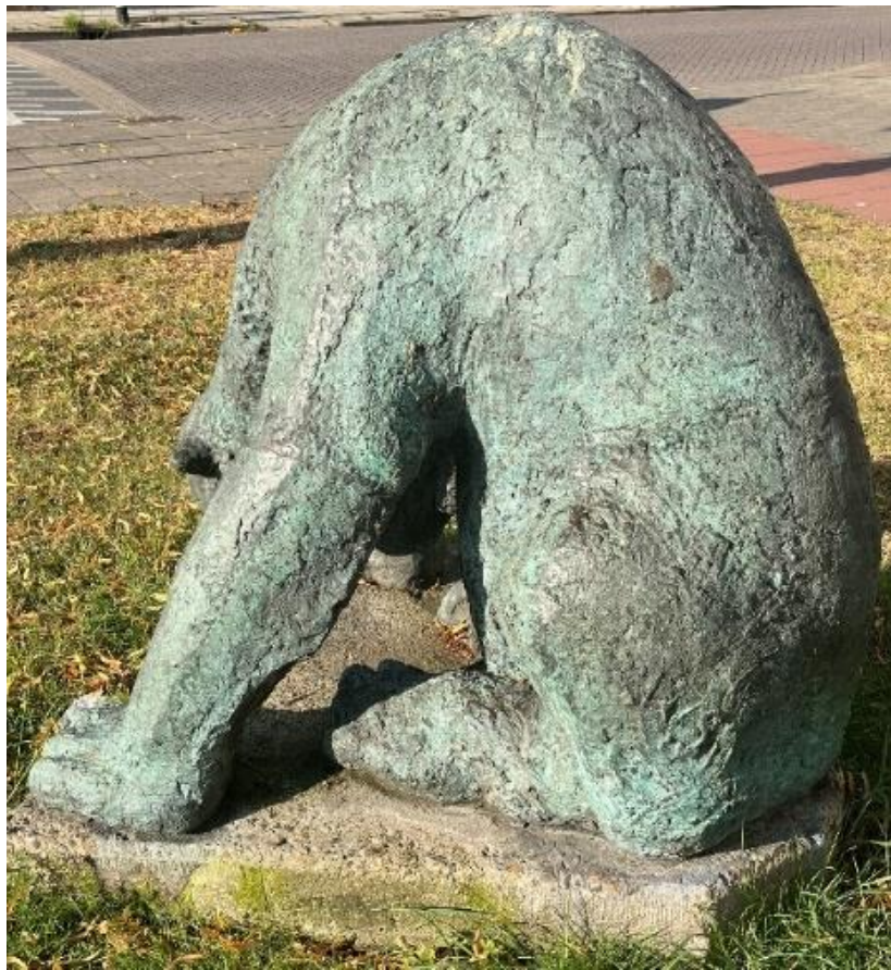
augustus 2022