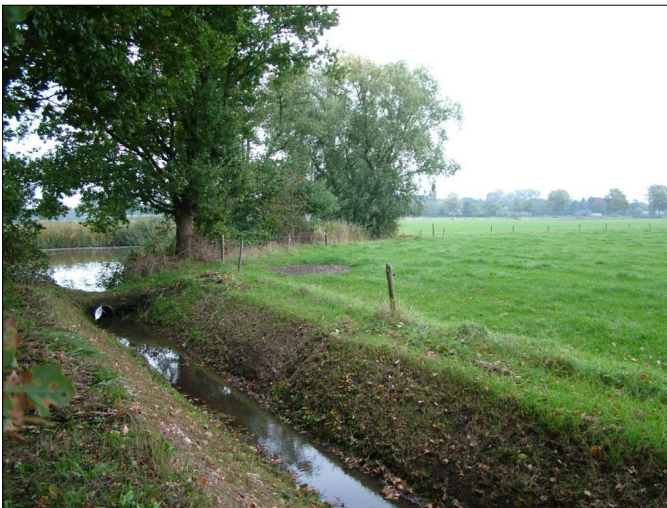
Heijstmans veld in 2017 strekt zich uit vanaf de Grote Mugheuvelse wiel noordwaarts...

De veldnaam heijstmans veld is in onbruik geraakt.