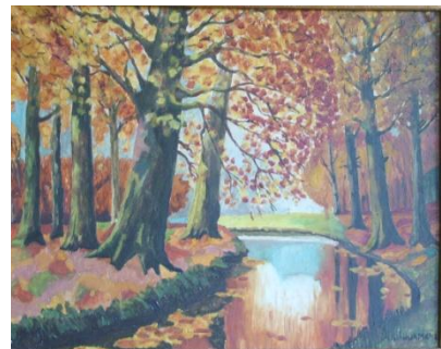
Drie schilderijen door Ties gemaakt.