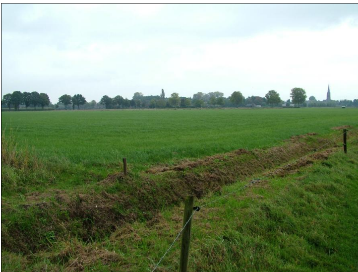
... tot aan de Donksestraat, de bomenrij op de achtergrond links. Geheel rechts de Dungense kerk.