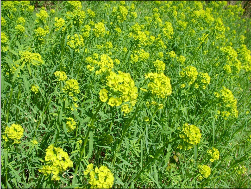
Het gaat de nakomelingen van de Dungense heksenmelk heel goed, dank u.

A ls u de plant op de onderstaande foto herkent van een Dungense vindplaats hebt u een goed geheugen.